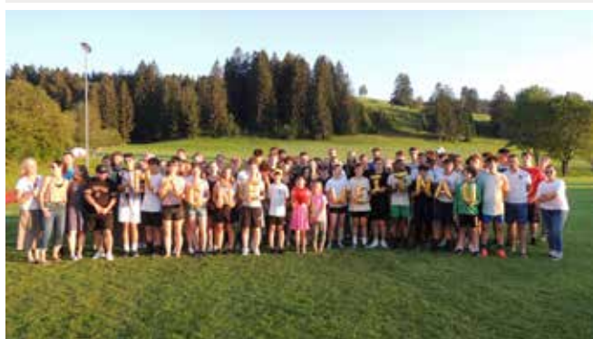
Séjour des jeunes Magnésiens en Allemagne en 2024