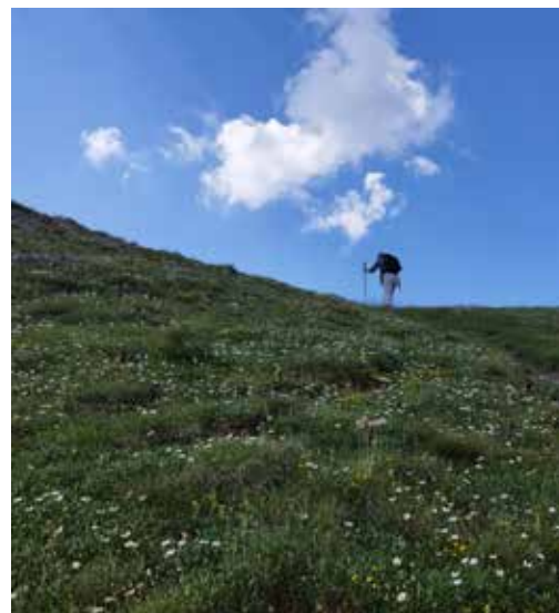
Randonnée dans les Alpes durant l'été 2025

En marchant ! La randonnée et la marche nordique sont mes échappées belles. J'ai besoin de bouger, de