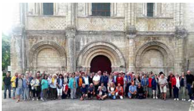
Séjour des adultes de Weitnau en France en 2022

« Nous aimons les recevoir, et quand nous allons là-bas, nous sentons que nous sommes les bienvenus. C'est toujours très convivial et chaleureux », confient les membres du comité. En janvier 2026, une exposition à la médiathèque viendra retracer cette belle histoire de jumelage, tandis que d'autres projets sont déjà à l'étude pour continuer à faire découvrir la culture allemande aux Magnésiens.