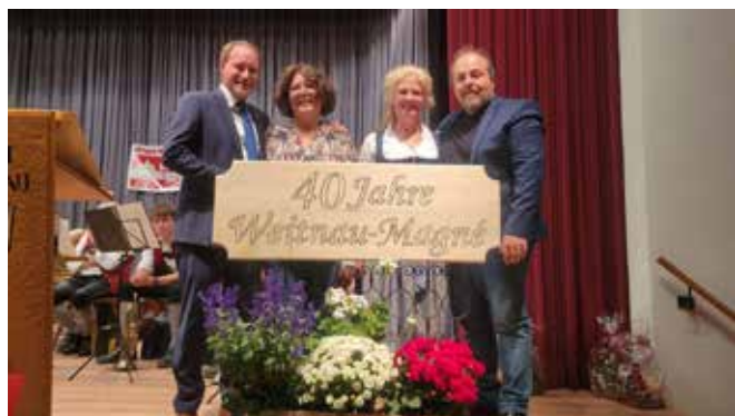
Soirée officielle lors du voyage à Weitnau de septembre 2025