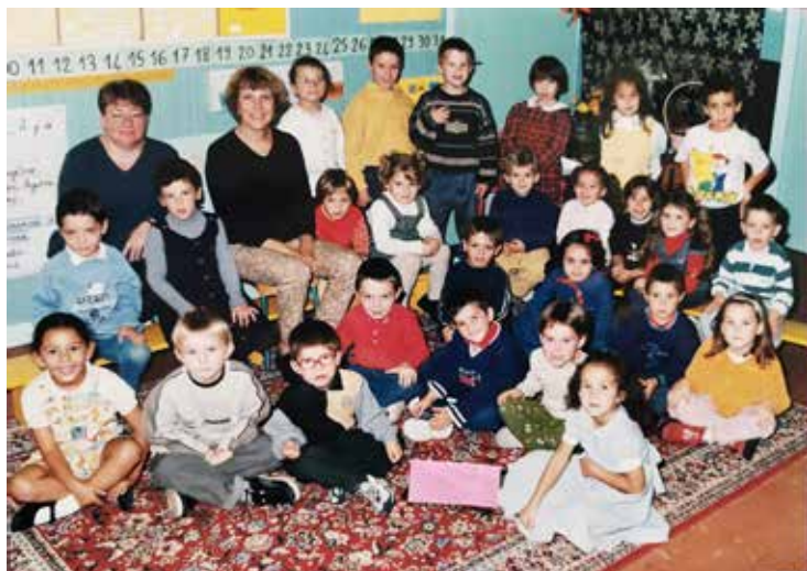
Une des nombreuses photos de classe (Année scolaire 2000-2001)