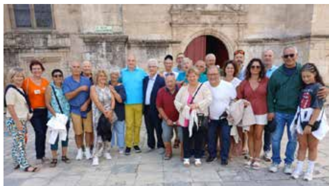
Avec les italiens lors du Festival de peinture de Magné 2025

Situé dans la région de Campanie, au sud de l'Italie, Vallesaccarda est un charmant village perché sur les collines de la province d'Avellino. Entourée de paysages verdoyants et réputée pour sa gastronomie — notamment ses pâtes artisanales et son huile d'olive — la commune italienne partage avec Magné un goût pour la convivialité et la culture locale.