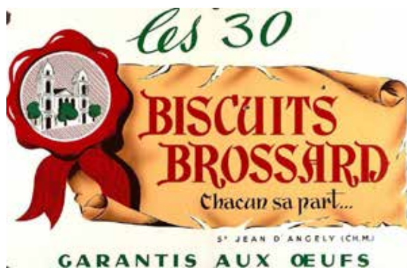
Ancienne publicité BROSSARD