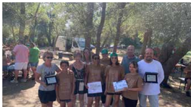
Remise des cadeaux du concours de dessin à Vallesaccarda

Le prochain grand rendez-vous d'échanges est prévu pour août 2026. L'année prochaine, plusieurs événements également au programme : la Pasta Party traditionnelle, organisée chaque année, se tiendra le 6 février et le 6 novembre 2026, et le comité participera également au marché de Noël du comité de jumelage Magné-Weitnau. Autant d'occasions de préparer le futur voyage en Italie et de continuer à faire vivre le jumelage entre Magné et Vallesaccarda.