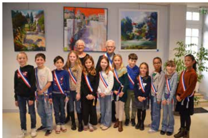
Le Conseil municipal des enfants de Magné (de gauche à droite) :

Une écharpe tricolore et un kit de l'élus ont été remis à chacun des conseillers.