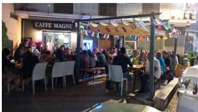
La Caffè Magné à Vallesaccarda