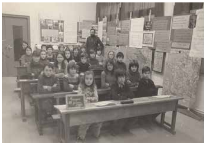
Reconstitution en 1980 d'une ancienne classe à la salle polyvalente