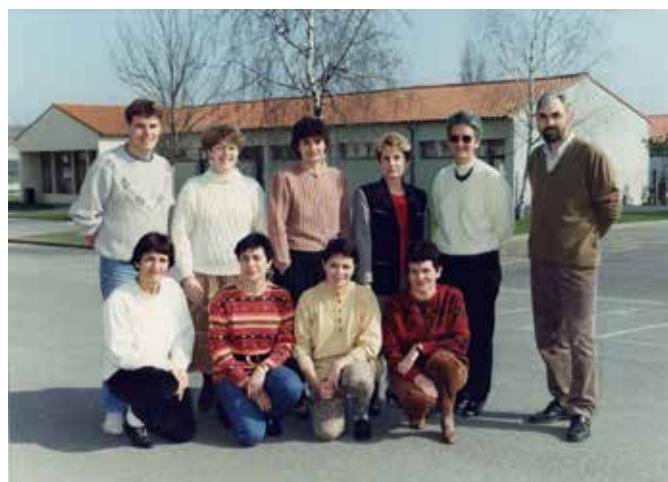
Photo des enseignants de la nouvelle école