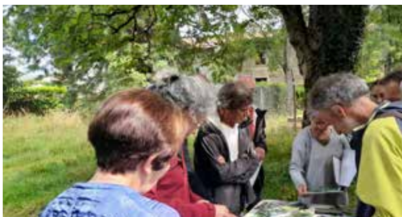
Atelier du 6 juillet 2024