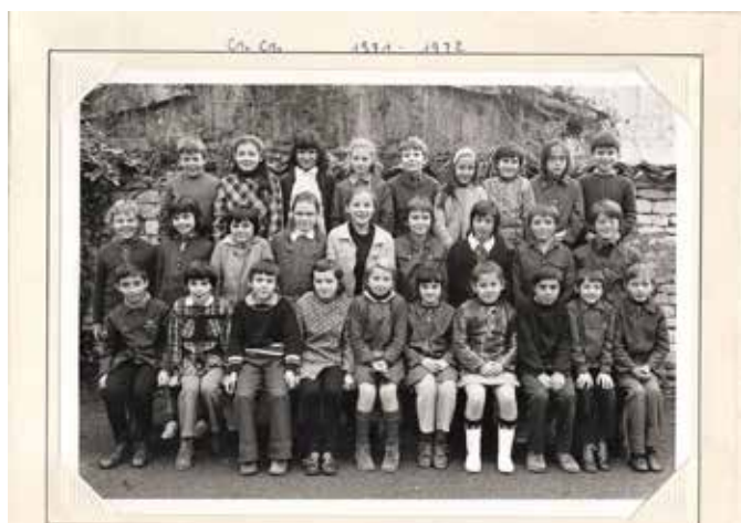
Photo de classe CM1-CM2 1971-1972 (ancienne école)

Le site retenu pour construire ce nouveau groupe scolaire faisait parti d'un grand ensemble de terrains destinés à la