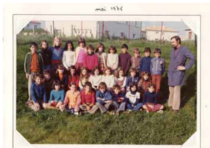
Photo de classe CM1-CM2 1976

En 1997, un projet ARVEJ (Aménagement des Rythmes de Vie des Enfants et des Jeunes) était créé avec la contribution des enseignants, du centre socioculturel, des bénévoles d'associations et de « jeunesse et sport ». Cet outil permettait aux élèves de découvrir des sports (judo, billard, taekwondo, sport collectifs, escalade, tennis de table, danse, ...), des activités culturelles (théâtre, échecs, anglais, allemand, ...) et des activités manuelles (peinture sur soie, dessin, modèle réduit...) afin de leur faire découvrir les activités praticables hors du temps scolaire.