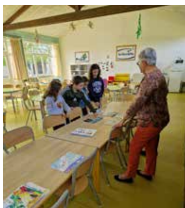
Vote des dessins gagnants par le Conseil municipal des enfants