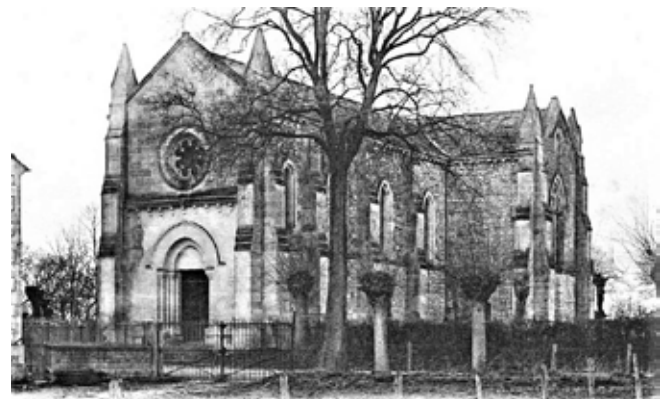
Pèlerinage de Ste-Macrine à Magné (s Sevre). - La Chapelle de Ste Macrine sur la butte

Pour toujours ? Pas tout à fait. Le champ qui jouxte l'église, celui-ci même au creux duquel nous avons été retrouvées porte notre nom. Le champ des idoles. Vous aurez beau nous chercher, vous ne parviendrez pas à nous trouver. Vous avez perdu notre trace, il y a belle lurette. Qu'importe après tout. Nous conserverons le souvenir d'avoir été importantes à vos yeux pendant un temps, et par ce nom énigmatique donné à ce simple lopin de terre, nous n'avons pas fini de susciter bien du mystère.