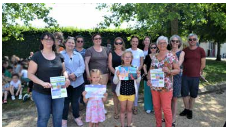
Les gagnantes entourées des enseignants du groupe scolaire et des élus du conseil municipal qui ont organisé ce concours