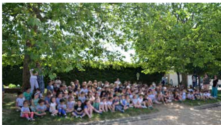
Bravo à tous les enfants !