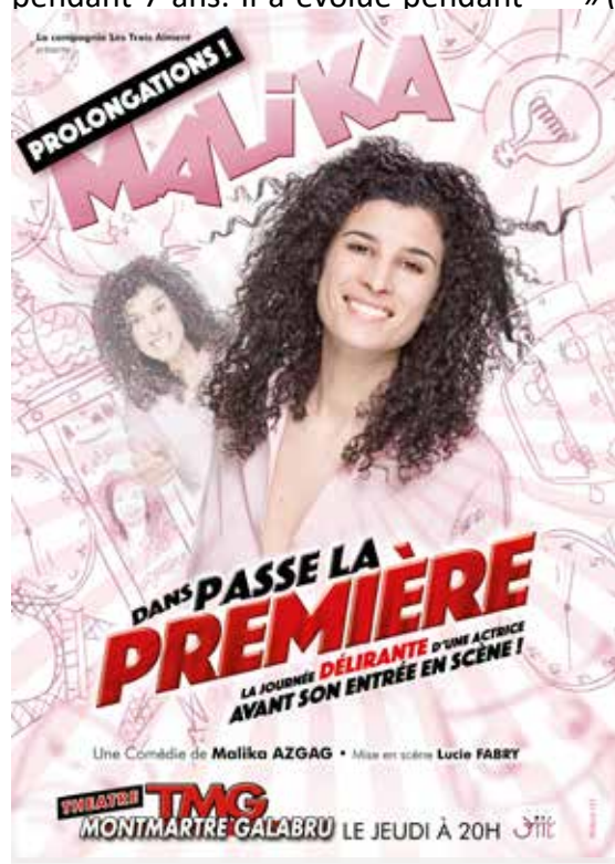
L'affiche de son spectacle

Quand je reviens, ce que j'aime le plus, c'est prendre un pique-nique et passer la journée au bord de l'eau, ça change tellement de la vie parisienne !