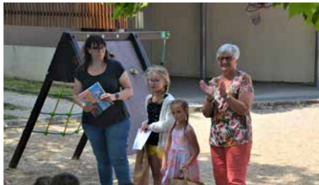
L'annonce des résultats et récompense des gagnantes