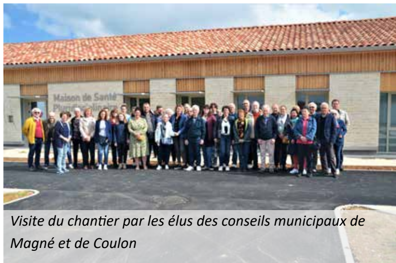
Visite du chantier par les élus des conseils municipaux de Magné et de Coulon