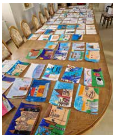
Une partie des dessins réalisés

Un grand bravo à tous les enfants et un grand merci aux enseignants pour leur implication !