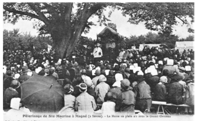
Pèlerinage de Ste Macrine à Magné (s Sevre). - La Messe en plein air sous le Grand Ormeau Gélineux Max Ménard, Paris