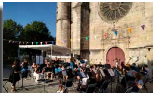
13/07/2022 - Concert du vent dans les cordes