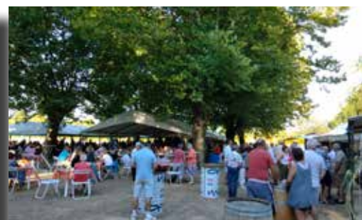
06/08/2022 - Guinguette (Festi'Magné)