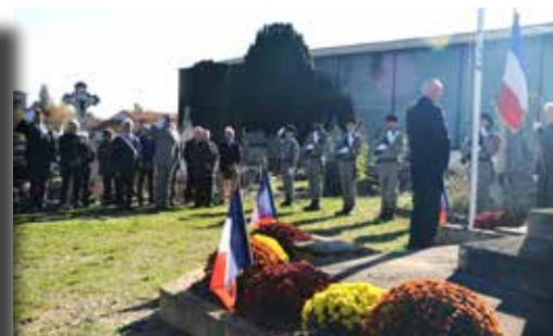
11/11/2022 - Commémoration