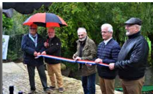
15/10/2022 - Inauguration du port communal du Gué