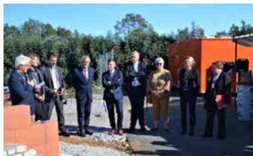
20/09/2022 - Cérémonie de la pose de la 1ère pierre et réunion publique sur la MSP