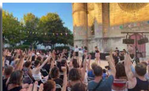
05, 12, 19, 26/07 et 02/08/2022 - Soirées Théâtre d'impro (Guilde de l'improbable)