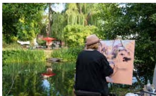
22, 23 et 24/07/2022 - Festival de peinture (Magné Animation)