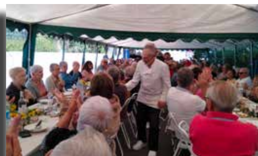
18/09/2022 - Fête du pain (Amis du four à pain et du petit patrimoine)