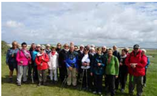
23/05/2022 - Séjour Côte d'Opale (Les randonneurs du Marais)