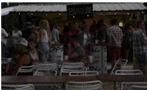
08, 09 et 10/07/2022 - Festival sur la comète (Alunissons)