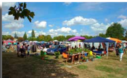
04/09/2022 - Vide grenier (Festi'Magné)