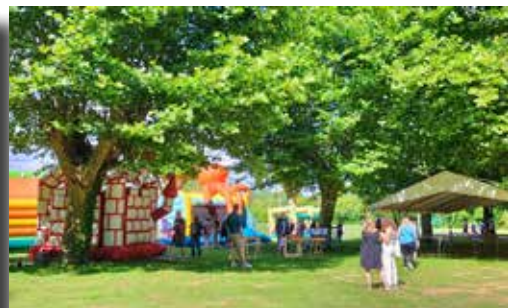
01/07/2022 - Fête de l'école (Association des parents d'élève)