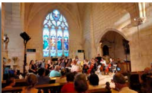
09/07/2022 - Eurochestreries