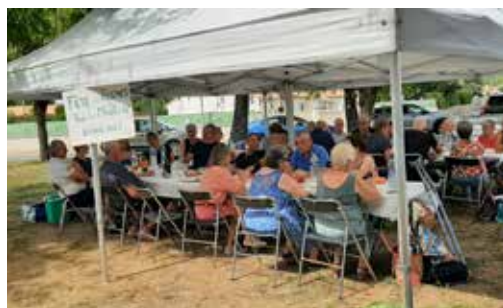
27/08/2022 - Fête des voisins de la rue du moulin