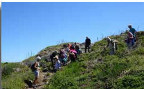
13/06/2022 - Journée sur l'île d'Yeu (Les randonneurs du Marais)